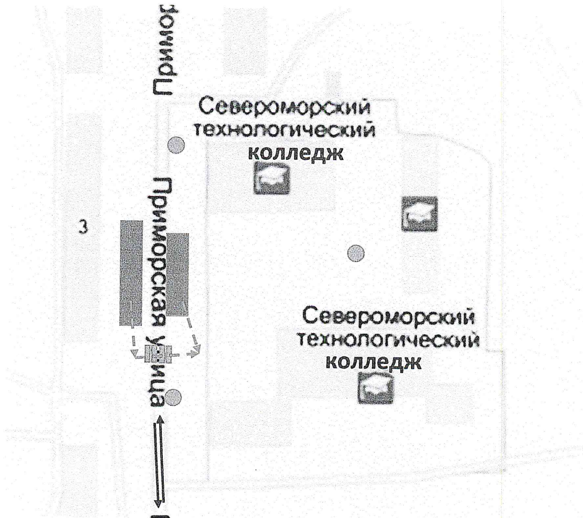
Схема организации дорожного движения в непосредственной близости от «СТК» с размещением соответствующих технических средств, маршруты движение обучающихся (студентов) и расположение парковочных мест.